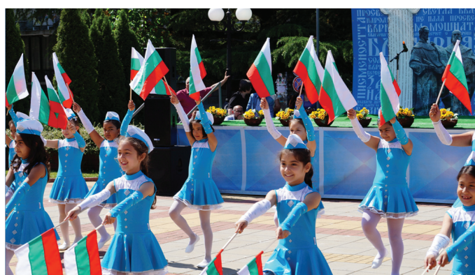
заведения и читалищата в общината Място – площад „Св.Св.Кирил и Методий“ гр. Сунгурларе

11:00ч.-Празничен концерт с участието на ученици от учебните