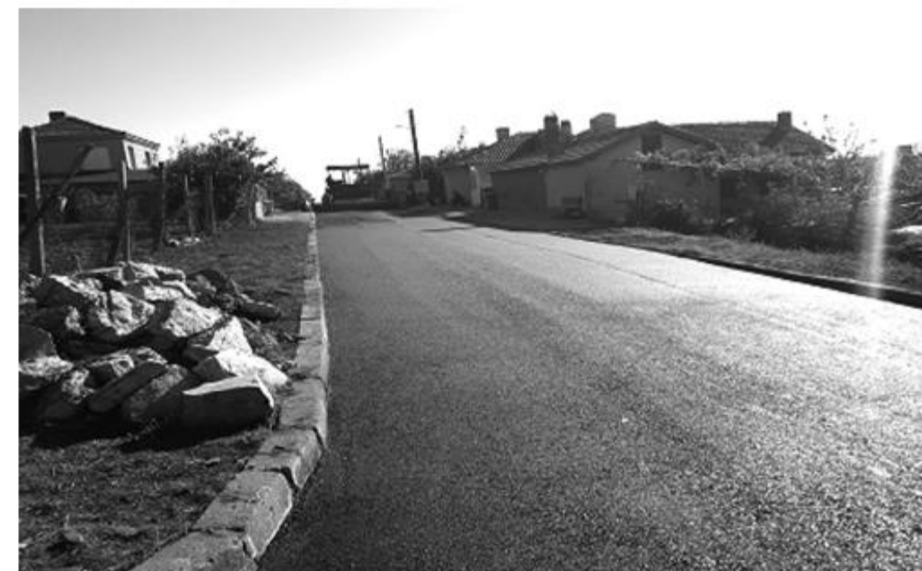
улица в село Прилеп