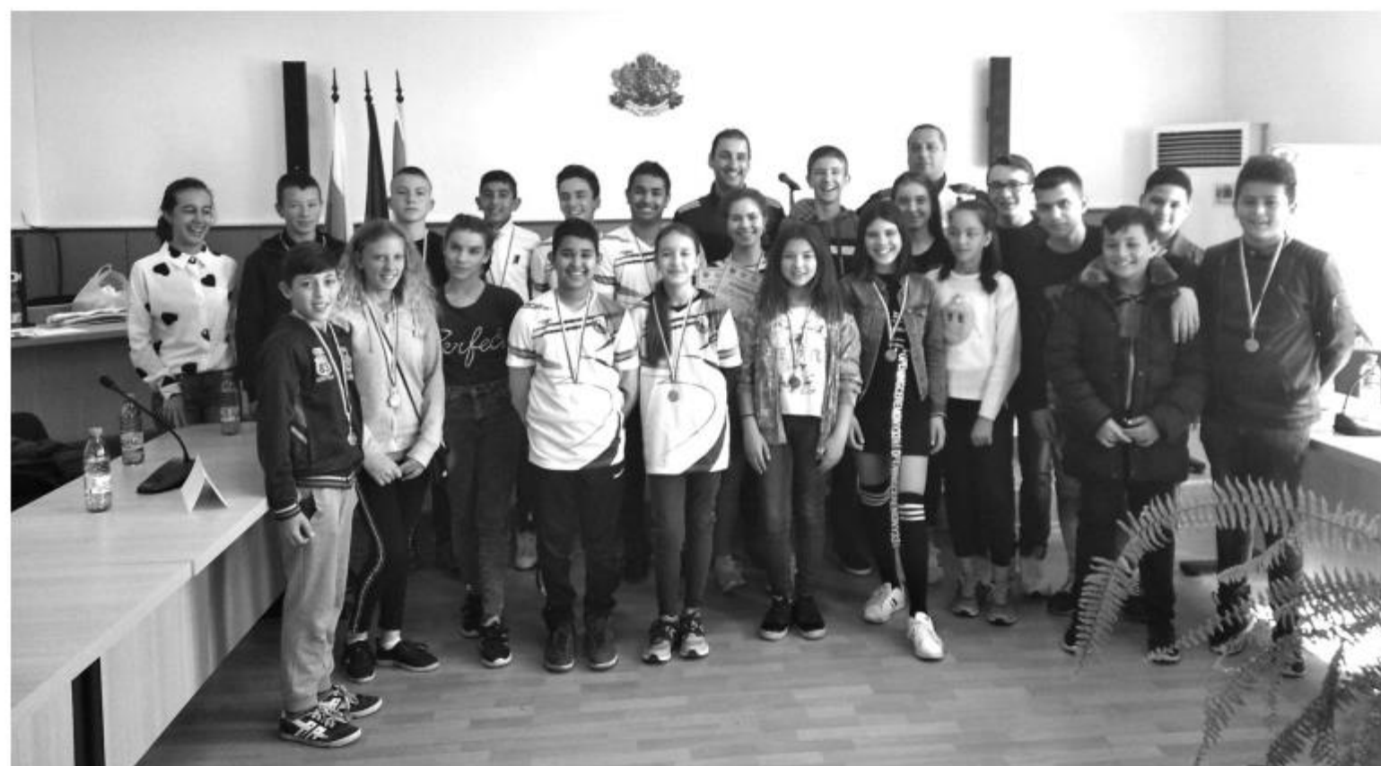
място за отбора на ОУ „Отец Паисий“ с. Съединение. Всички участници получиха грамоти за достойно представяне.

Залата на Общински съвет събра участници от всички училища на община Сунгурларе. Знанията си показаха ученици от ОУ „Христо Ботев“ с. Лозарево, ОУ „Васил Левски“ с. Прилеп, ОУ „Св. Св. Кирил и Методий“ с. Манолч, СУ „Христо Ботев“ гр. Сунгурларе, ОУ „Св. Св. Кирил и Методий“ с. Грозден, ОУ „Отец Паисий“ с. Съединение. По регламент състезанието се проведе в три кръга: решаване на тест-листовка, викторина, а в трети етап отборите бяха подложени на проверка на знанията за оказване първа долекарска помощ при възникнала ситуация и поддръжка пъзели с пътни знаци. След много емоции, много упорита работа и много забавление журито обяви победителите. Безспорни победители станаха учениците от СУ „Христо Ботев“ които ще представят община Сунгурларе на областният кръг на състезанието. Победителите получиха грамоти и медали. На второ място се класира отбора на ОУ „Васил Левски“ с. Прилеп, а трето