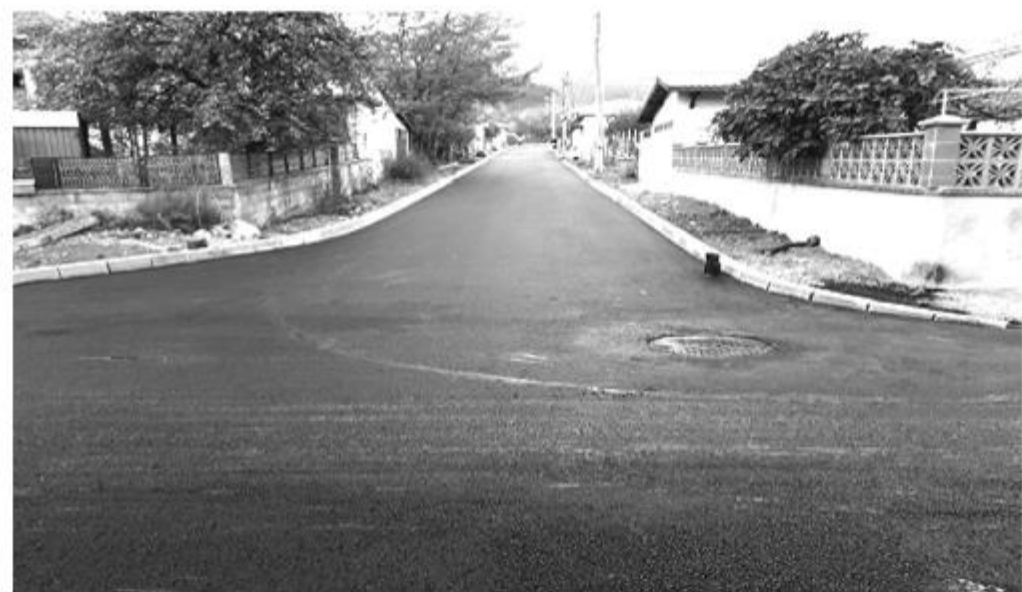
улица в село Съединение

Повече от половин милион лева бяха вложени през миналата година за асфалтиране на улици в населените места от общината. Асфалтирана беше по една