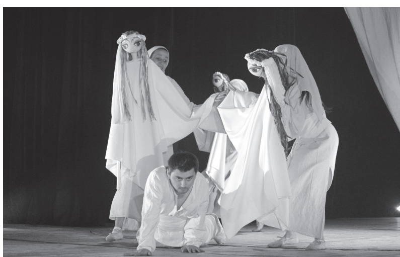
На 20 септември жителите на Сунгурларе имаха удоволствието да гледат театралната постановка на театър „Любомир Кабакчиев“