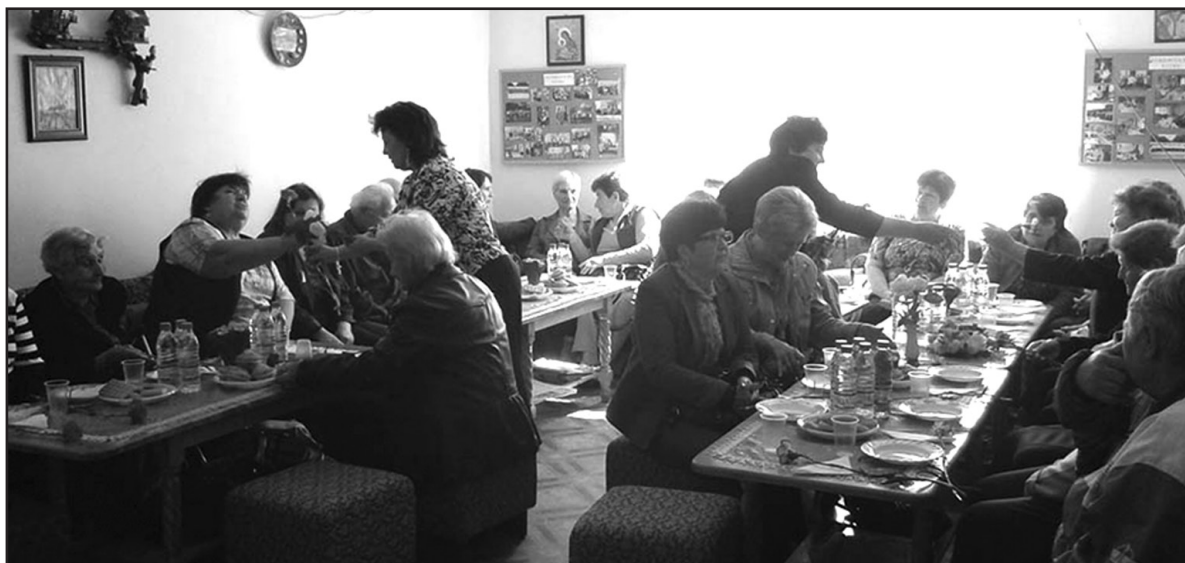
ПК с. Чубра

С много емоции и спомени за училищния живот продължи срещата, разбира се зазвуча и "Върви, народе, възродени, към светли бъднини върви..."