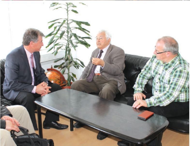
На 18-ти април световноизвестният физик проф. Минко Балкански се срещна с кмета на община Сунгурларе инж. Васил Панделиев и учители и ученици от СОУ „Хр. Ботев“. Срещата беше

Срещата с проф. Минко Балкански премина при огромен интерес.