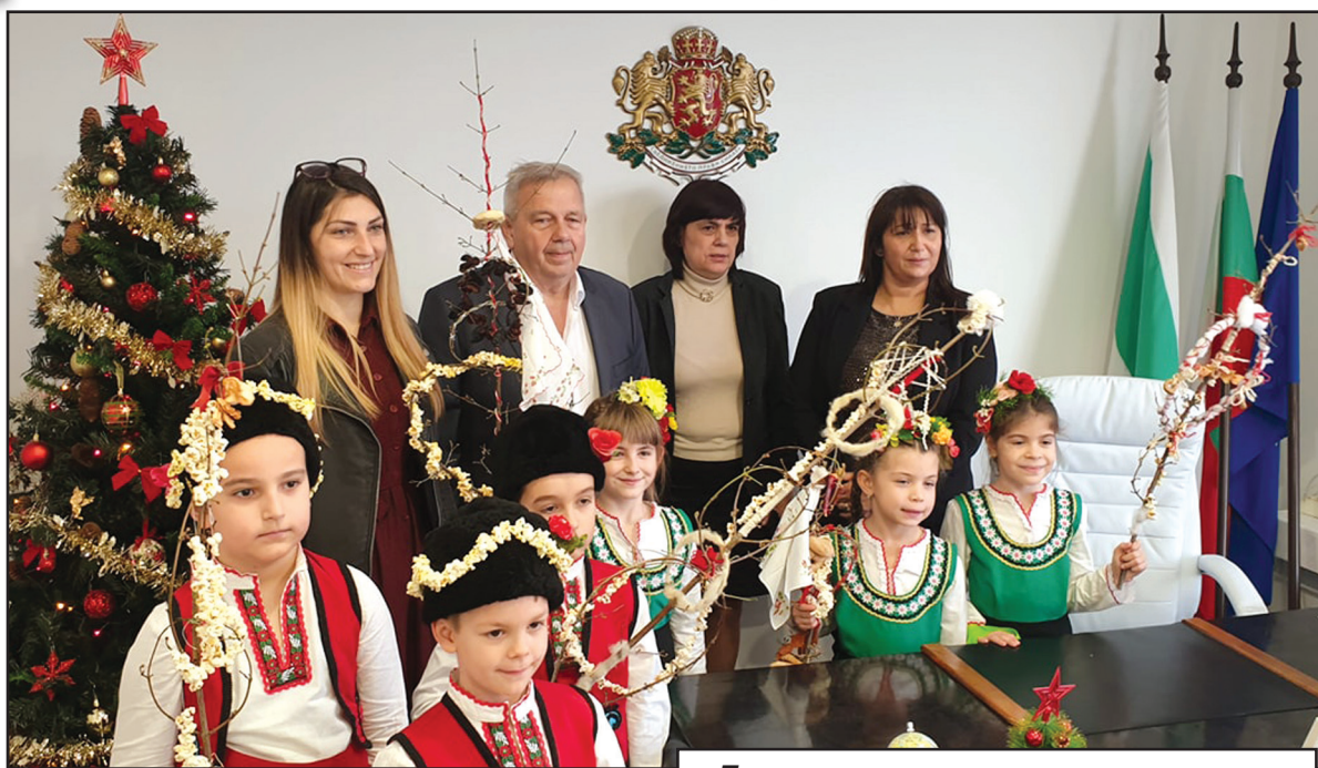
Децата ги посрещнаха с песни

Първият работен ден започна с песни на сурвакарите от ДГ "Слънце" - Сунгурларе и първи и втори клас на СУ "Христо Ботев" - Сунгурларе. За талантивите деца бяха подготвени торбички с лакомства и изненади.